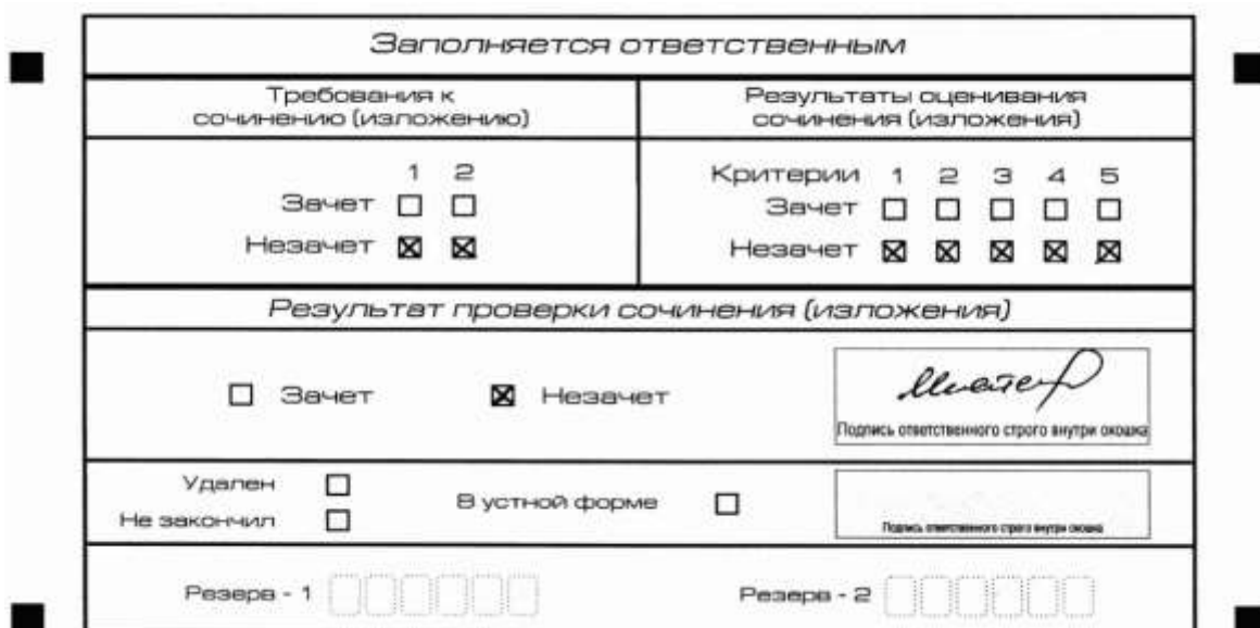
Рис. 8. Область для оценки работы

Выставляется "незачет" за невыполнение требования N 2. В клетки по всем критериям оценивания выставляется "незачет". В поле "Результат проверки сочинения (изложения)" ставится "незачет" (см. рис. 9).