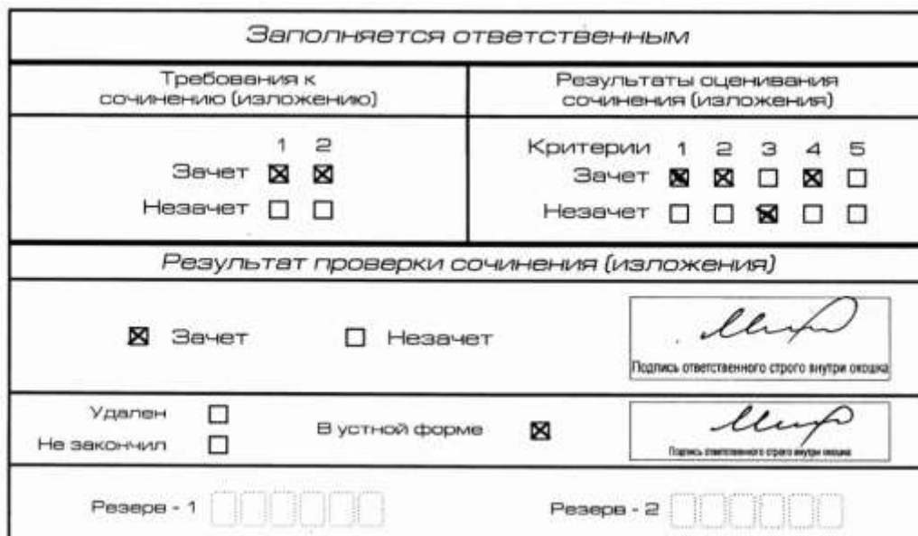
Рис. 11. Область для оценки работы сочинения (изложения) в устной форме