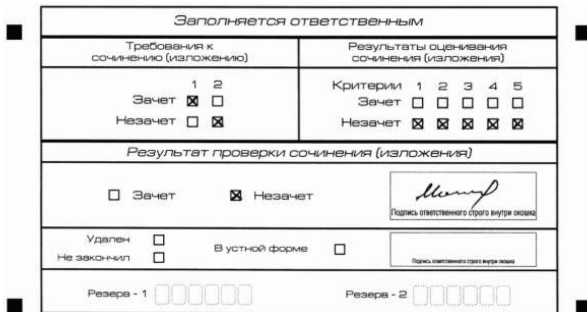
Рис. 9. Область для оценки работы

Если итоговое сочинение (изложение) соответствует требованию N 1 и требованию N 2 , то выставляется "зачет" за выполнение требования N 1 и требования N 2 . Указанные сочинения (изложения) далее оцениваются по критериям.