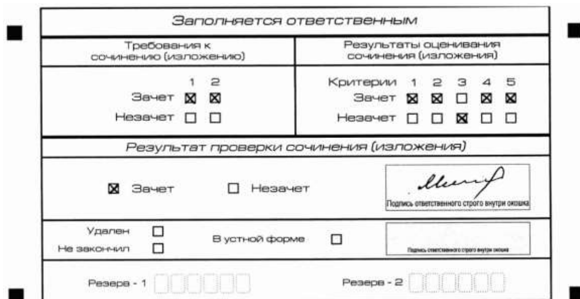
Рис. 10. Область для оценки работы

После окончания заполнения бланка регистрации ответственное лицо ставит свою подпись в специально отведенном для этого поле.